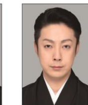
おのえ きくのすけ 尾上菊之助

日時：平成30年 7月8日 (日) 昼の部 開演 12:00 (開場 30分前)