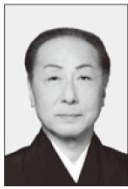
いちかわだんそう 市川團藏