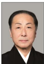
いちかわだんぞう 市川團蔵