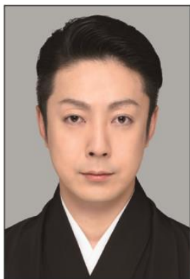
おのえ きくのすけ 尾上菊之助

大 太 高 次 ■高 郎 郎 郎 坏 名 足 冠 某 者 売 者 甲 花 梶 逢 早 屋 形 原 与 屋 平 五 吾 郎 星 御 所 五 郎 蔵 影 土 右 衛 門 蔵 士 右 衛 門 蔵 ■近江のお兼 近江のお兼 市市中尾 市市中中中坂尾 中 中 川村村上 川村村村村東上 村 村 團橘萬菊 團橘萬米梅彦菊 梅 梅 太 太 之 蔵 郎 郎 助 太 太 三 之 蔵 郎 郎 吉 枝 郎 助 枝 枝