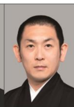
ほんどうひこさぶろう 坂東彦三郎